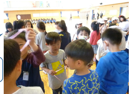
2年生からメダルのプレゼント